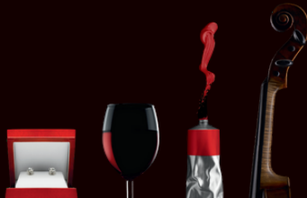
Vos objets d'art et de collection