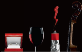
Vos collections privées

Nous proposons notamment des contrats adaptés pour :